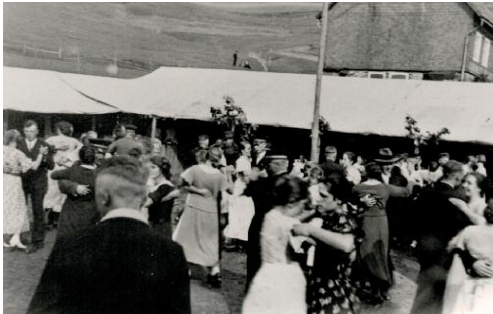
Festreiben auf dem Wühlplatz (Am Röllchen) in den 1930er Jahren